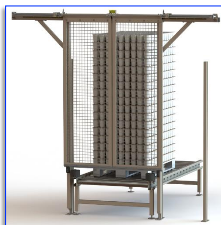
Abbildung 2: Maschinenschutzschiebetür geschlossen